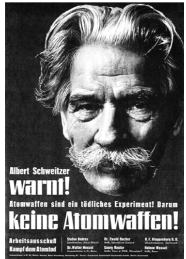
Albert Schweitzer auf einem Flugblatt der Friedensbewegung. Etwa 1956