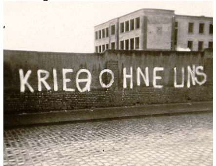
Wandparole in Saarbrücken. Etwa 1957

Heute, am 27. März 2011, also 57 Jahre nach Dr. Schweitzers erstem Appell (1954) an die Regierenden und die Völker der Welt, dem Wahnsinn des Wettrüstens und der atomaren Bedrohung allen menschlichen Lebens ein Ende zu setzen, stehen wir nach wie vor vor der selben Bedrohung. Es sind nicht nur die Atomwaffen, die noch einsatzbereit sind, sondern dazu kommen nun die AKWs zur friedlichen Energiegewinnung. Würde Dr. Albert Schweitzer, wenn er noch unter uns wäre, die gleiche Warnung wieder aussprechen, oder würde er sie gar verschärfen? Um meine Frage zu konkretisieren, lese ich einen Brief vor, der am 14. April 1954 im Londoner „Daily Harald“ veröffentlicht wurde: