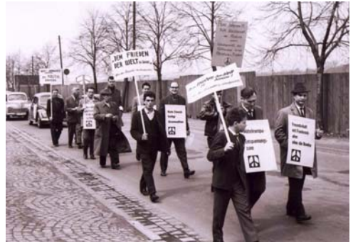
Ostermarsch in Saarbrücken. Etwa 1963

Im Vorwort zur 3. Auflage des Buches von Dr. Albert Schweitzers: „Friede oder Atomkrieg“ schreibt im Jahre 1984 Erhard Eppler, damaliger SPD-Politiker, der zwischen 1968 und 1974 Bundesminister für wirtschaftliche Zusammenarbeit war: „Was Albert Schweitzer vor zwei Jahrzehnten zu Atomrüstung, Atomtests und Atomkrieg zu sagen hatte, war eher trockene Information, nüchterne Aufklärung über Sachverhalte, allerdings so präzise, dass dem auch heute...“ - also mehr als fünfzig Jahre später „...wenig hinzufügen ist“; Ich füge hinzu: ...außer dass Dr. Albert Schweitzer