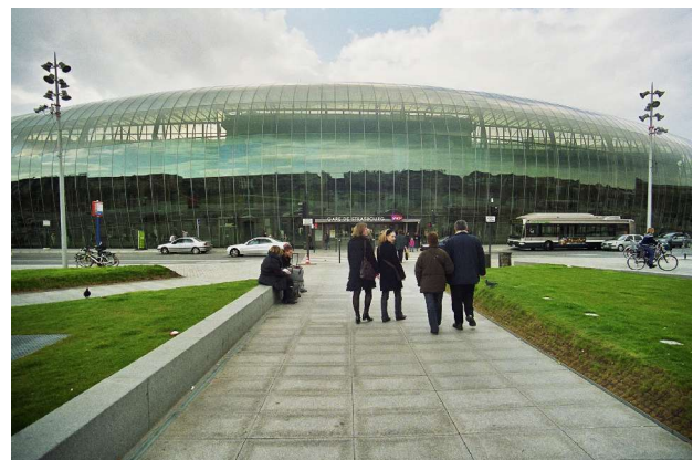
Das Strasbourger Raumschiff – Der Gare Central