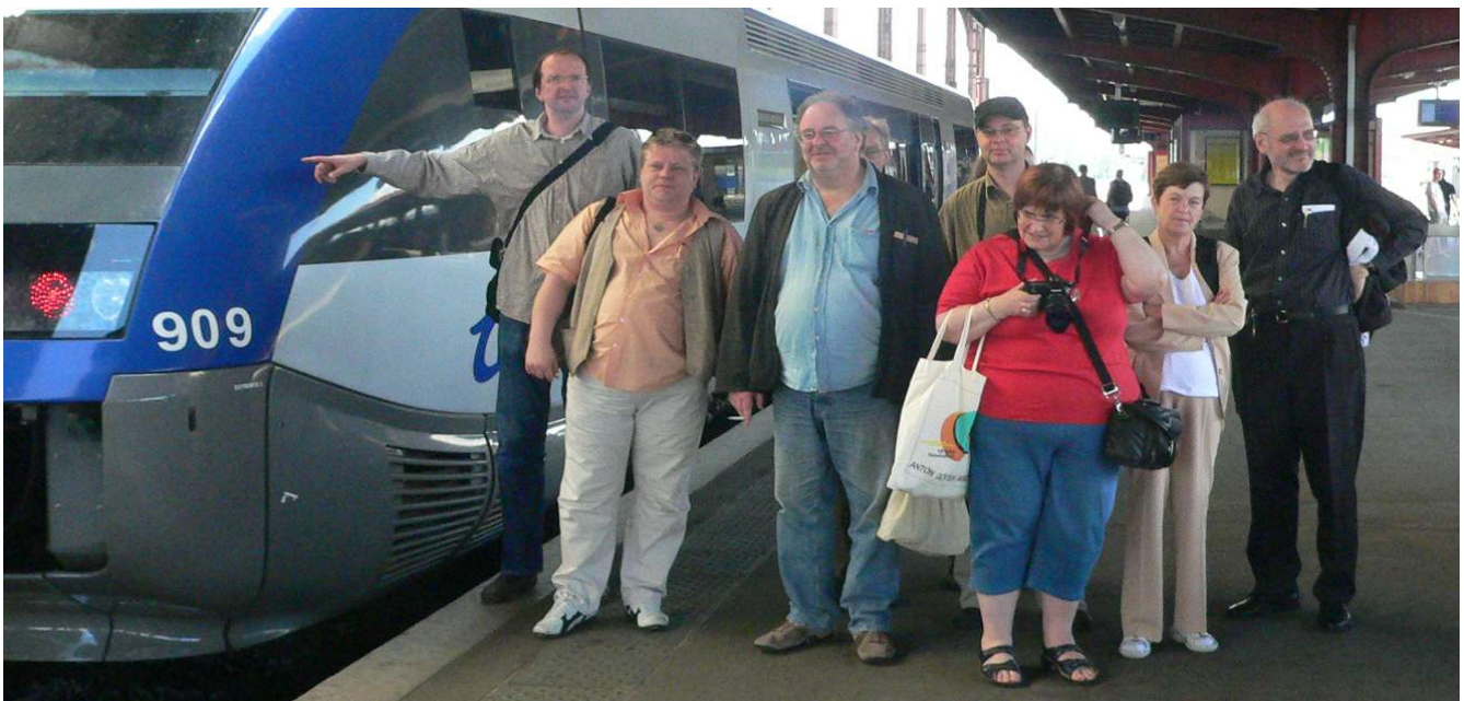
Auf Achse zur interregionalen Erkundungsfahrt