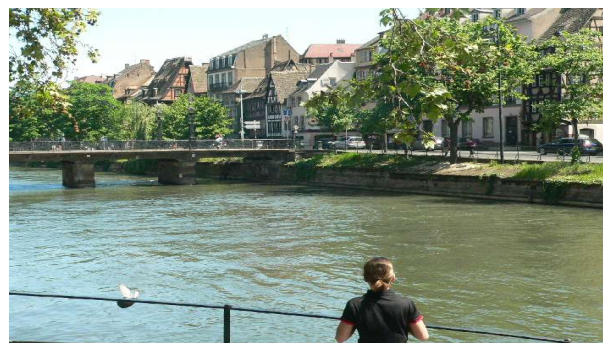
Spaziergang entlang des romantischen Fließchens Ill