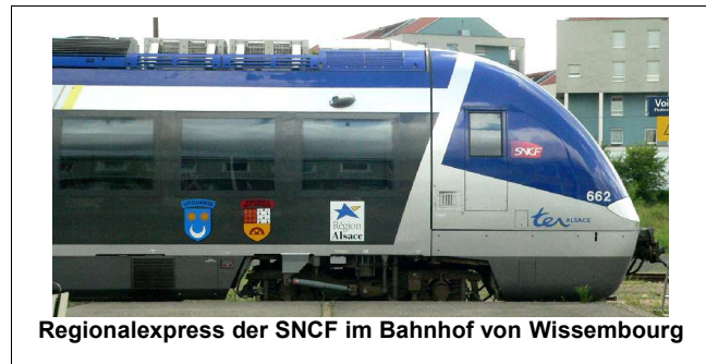
Regionalexpress der SNCF im Bahnhof von Wissembourg

Mit dem innereuropäischen Grenzübertritt vom elsässischen Wissenbourg nach Landau in Rheinland Pfalz mussten die dritten Tickets gekauft werden. Um so klarer wurde hier die Forderung nach einem grenzüberschreitenden Verkehrsverbund für die Großregion, mit einheitlichen Bahn und Verkehrsverbundkarten laut. Natürlich gehöre dazu auch die Verbesserung der ÖPNV-Anbindung von und nach Luxemburg, sowie die Reaktivierung anderer wichtiger Bahnstrecken in der Großregion. Die Bahn sei unerlässlich, Europas Regionen für seine Bürger in Zukunft erlebbar zu machen. Angesichts der rapide steigenden Treibstoffkosten haben die Eisenbahnen in Zukunft eine reelle Chance dem Individualverkehr auf der Straße Paroli zu bieten. Diese Chance dürfe nicht mit dem Kahlschlag weiterer Bahnlinien vertan werden, so das einhellige Fazit der Reisegruppe.