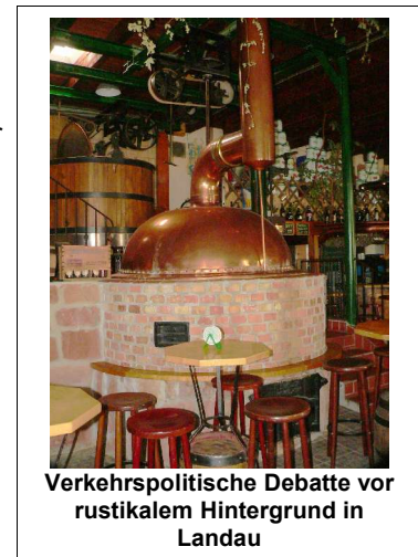
Verkehrspolitische Debatte vor rustikalem Hintergrund in Landau

Das Rheinland pfälzische Landau bot Gelegenheit zu einer verdienten Rast, ohne dass das Thema Schienenverkehr außer Acht geriet. Bei einer kleinen Malzeit wurde das Thema Güterverkehr in einer globalisierten Welt analysiert. Güter gehören auf die Bahn, um dies zu erkennen muss man kein linker Verkehrspolitiker sein, sondern nur Realist. Nicht nur in Deutschland ersticken die Autobahnen am jährlich steigenden Schwerlastverkehr. Zig Milliarden zur Instandsetzung der Fernstraßen und immer mehr schwere Unfälle, verursacht durch übermüdete Fernfahrer und einen immer ruinöser werdenden Wettbewerb im Speditionsgewerbe, fordern ein modernes Schienen-Logistikkonzept von den Verkehrsplanern. Klar ist hier die Forderung nach einem innovativen Konzept um beispielsweise Obst und Gemüse aus Andalusien per Schienen-Frigotransport in die Supermärkte Europas zu transportieren. Das gelte auch für die übrigen landwirtschaftlichen Produkte, vor allem jedoch für nichtverderbliche Güter. Das Beispiel der Autoindustrie zeige überdeutlich auf, das kein, an einem noch so fernen Standort gebauter PKW per LKW-Huckepack transportiert, um danach auf einem Zentrallager bis zu seinem Verkauf zwischengeparkt werden müsse. Diese Güter gehören sofort und zwingend auf die Bahn.