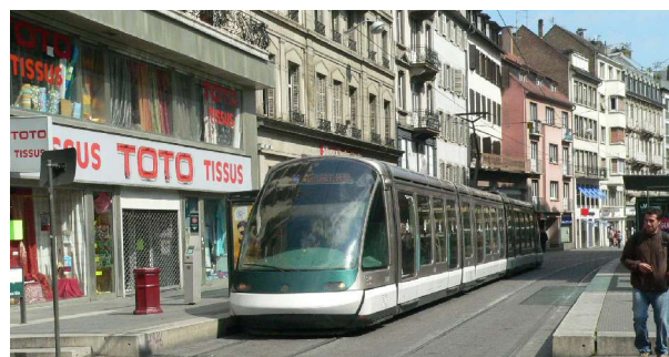
Die Tram in Strasbourg – Ein Meilenstein moderner Verkehrsplanung