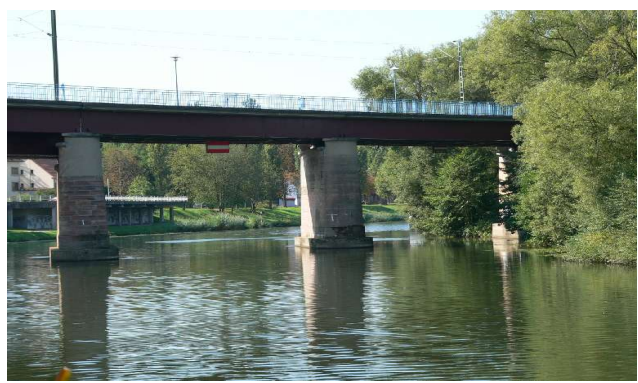
Pont des Prusses (dt. Preußische Brücke)

Die Tourist-Information am Strasbourger Hauptbahnhof war mit der Frage nach der Gültigkeit des "Saar-Elsass-Ticket" im städtischen Verkehrsverbund überfordert. „Darüber wissen wir nicht Bescheid“ so die ernüchternde Auskunft. Auch die Fahrer einiger Busse vor dem Bahnhof waren unterschiedlicher Auffassung zur Gültigkeit des "Saar-Elsass-Ticket". Von einem klaren „Ja, das Ticket gilt“, über ein schlichtes „Non“, bis hin zum „Weis nicht“, gingen die Meinungen auseinander. Für Klarheit sorgte dann ein Fahrdienstleiter. Das "Saar-Elsass-Ticket" endet am Gare Cental in Strasbourg. - Rien ne continue - Nichts geht weiter.